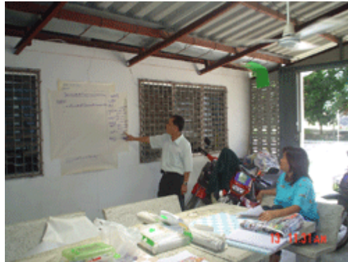
ภาพที่ 2 ลองหาทางออกโดยการลงเขียนให้เห็นทุกประเด็นที่น่า จะถามชาวบ้าน