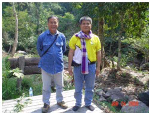
เพื่อนนักส่งเสริมการเกษตรของจังหวัดน่าน

เดินทางและทำอาหารกลางวันให้กับทีมงานได้รับประทานกันอย่างมีความสุขภายใต้ธรรมชาติของป่าที่เกิดจากการอนุรักษ์ของชุมชน