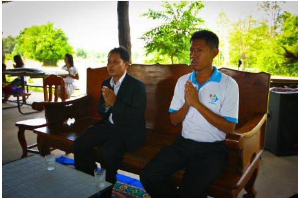
ภาพกิจกรรมโครงการ “ค่ายคุณธรรมนำชีวิต” โรงเรียนกระสังพิทยาคม ระหว่างวันที่ 9 - 11 มิถุนายน 2554