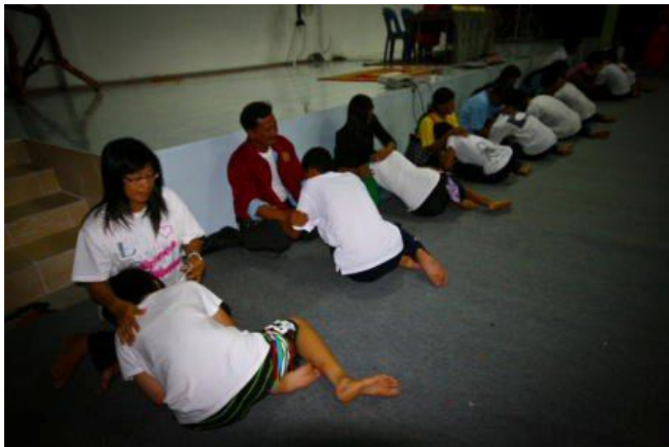
ภาพกิจกรรมโครงการ “ค่ายคุณธรรมนำชีวิต” โรงเรียนกระสังพิทยาคม ระหว่างวันที่ 9 - 11 มิถุนายน 2554