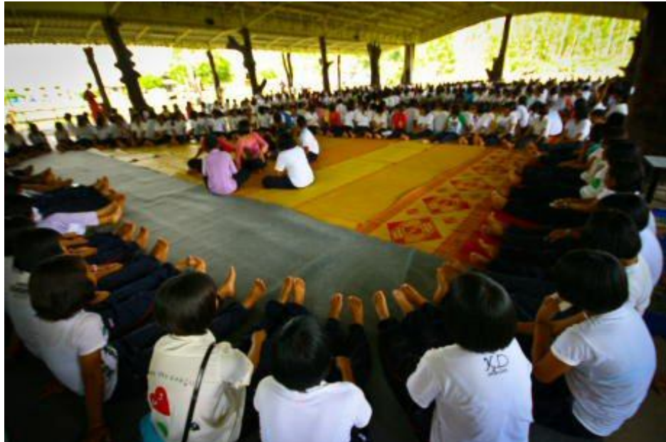
ภาพกิจกรรมโครงการ “ค่ายคุณธรรมนำชีวิต” โรงเรียนกระสังพิทยาคม ระหว่างวันที่ 9 - 11 มิถุนายน 2554