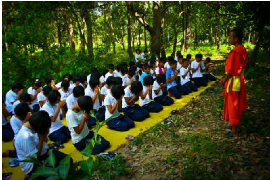
ภาพกิจกรรมโครงการ “ค่ายคุณธรรมนำชีวิต” โรงเรียนกระสังพิทยาคม ระหว่างวันที่ 9 - 11 มิถุนายน 2554