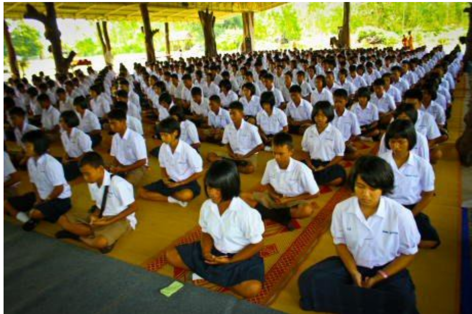
ภาพกิจกรรมโครงการ “ค่ายคุณธรรมนำชีวิต” โรงเรียนกระสังพิทยาคม ระหว่างวันที่ 9 - 11 มิถุนายน 2554