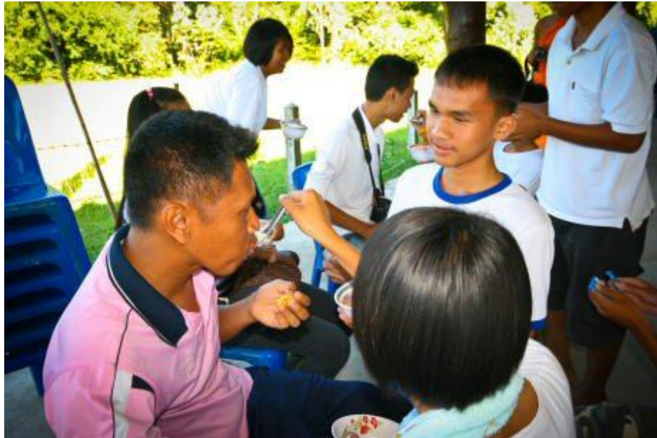
ภาพกิจกรรมโครงการ “ค่ายคุณธรรมนำชีวิต” โรงเรียนกระสังพิทยาคม ระหว่างวันที่ 9 – 11 มิถุนายน 2554