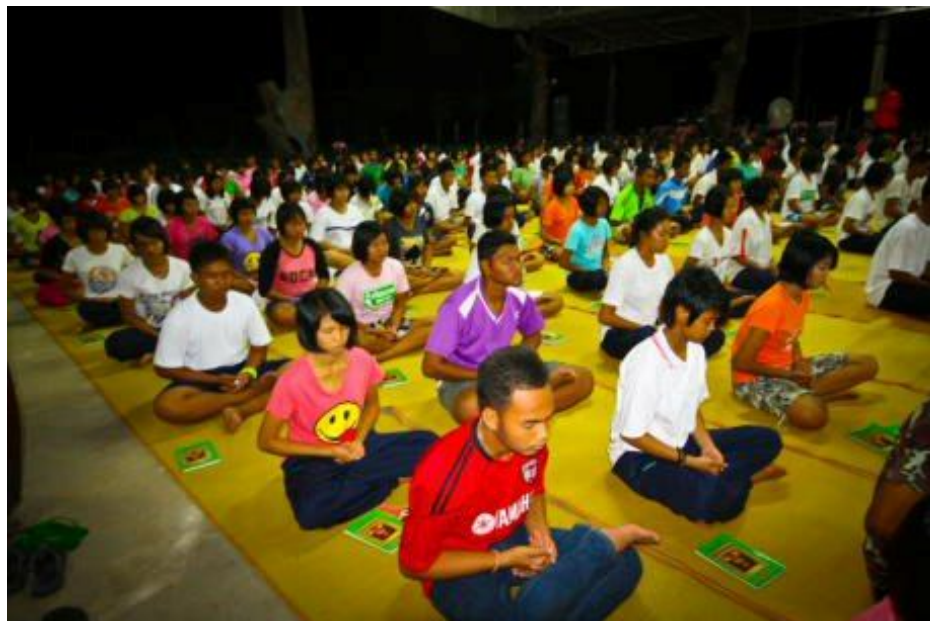
ภาพกิจกรรมโครงการ “ค่ายคุณธรรมนำชีวิต” โรงเรียนกระสังพิทยาคม ระหว่างวันที่ 9 – 11 มิถุนายน 2554