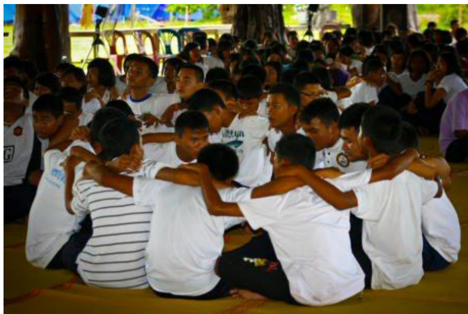
ภาพกิจกรรมโครงการ “ค่ายคุณธรรมนำชีวิต” โรงเรียนกระสังพิทยาคม ระหว่างวันที่ 9 - 11 มิถุนายน 2554