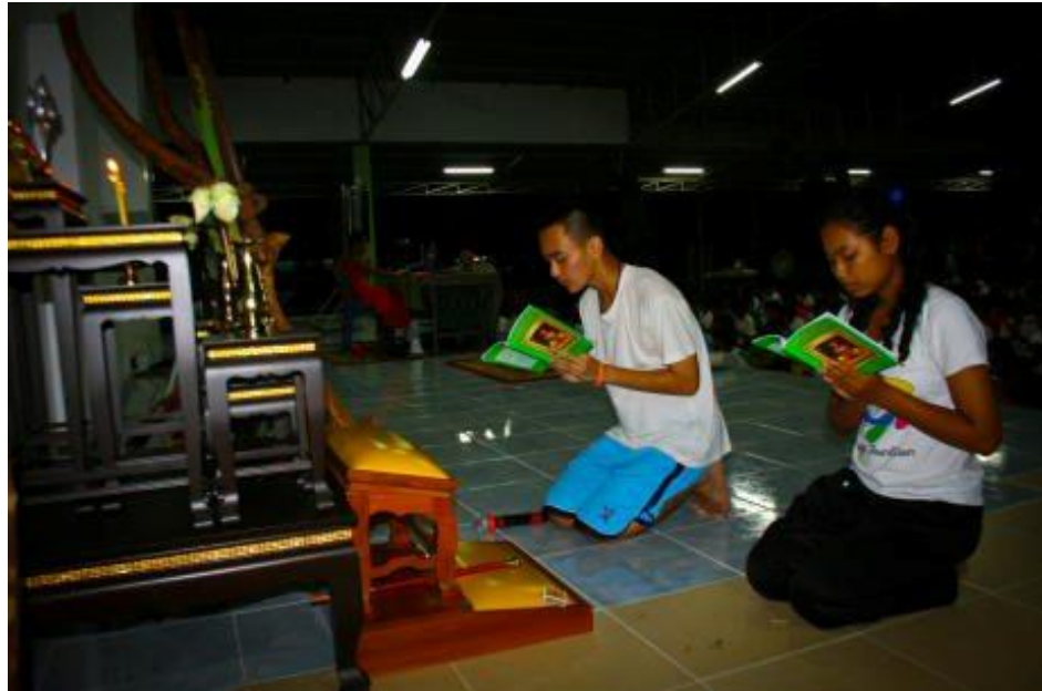
ภาพกิจกรรมโครงการ “ค่ายคุณธรรมนำชีวิต” โรงเรียนกระสังพิทยาคม ระหว่างวันที่ 9 - 11 มิถุนายน 2554