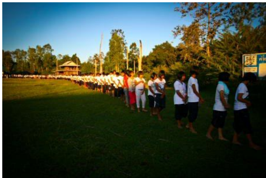
ภาพกิจกรรมโครงการ “ค่ายคุณธรรมนำชีวิต” โรงเรียนกระสังพิทยาคม ระหว่างวันที่ 9 – 11 มิถุนายน 2554