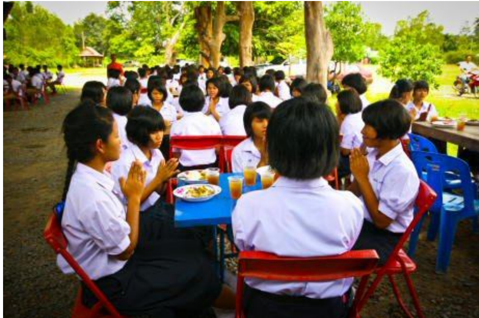
ภาพกิจกรรมโครงการ “ค่ายคุณธรรมนำชีวิต” โรงเรียนกระสังพิทยาคม ระหว่างวันที่ 9 - 11 มิถุนายน 2554