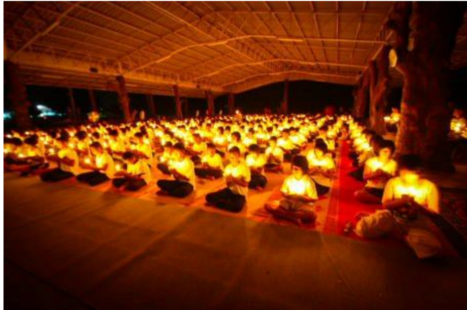
ภาพกิจกรรมโครงการ “ค่ายคุณธรรมนำชีวิต” โรงเรียนกระสังพิทยาคม ระหว่างวันที่ 9 - 11 มิถุนายน 2554