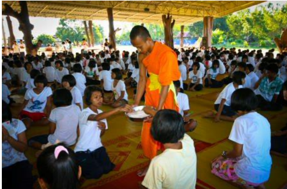
ภาพกิจกรรมโครงการ “ค่ายคุณธรรมนำชีวิต” โรงเรียนกระสังพิทยาคม ระหว่างวันที่ 9 – 11 มิถุนายน 2554