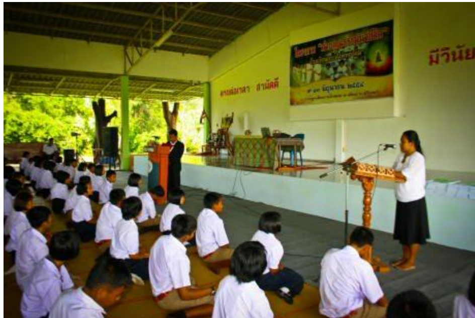
ภาพกิจกรรมโครงการ “ค่ายคุณธรรมนำชีวิต” โรงเรียนกระสังพิทยาคม ระหว่างวันที่ 9 - 11 มิถุนายน 2554