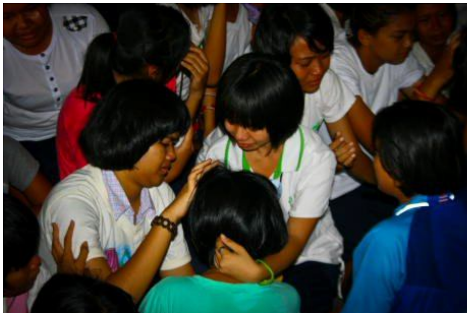
ภาพกิจกรรมโครงการ “ค่ายคุณธรรมนำชีวิต” โรงเรียนกระสังพิทยาคม ระหว่างวันที่ 9 - 11 มิถุนายน 2554