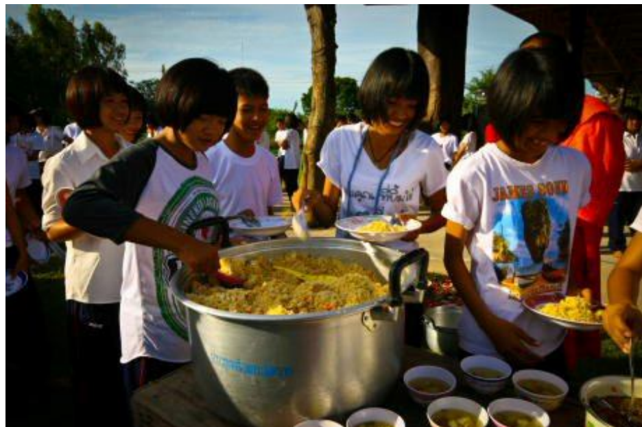
ภาพกิจกรรมโครงการ “ค่ายคุณธรรมนำชีวิต” โรงเรียนกระสังพิทยาคม ระหว่างวันที่ 9 - 11 มิถุนายน 2554