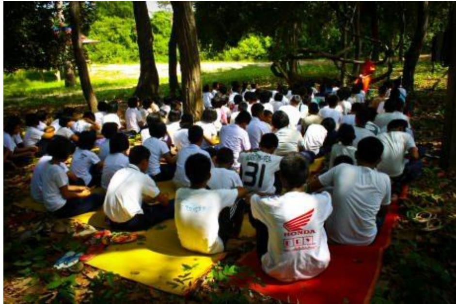
ภาพกิจกรรมโครงการ “ค่ายคุณธรรมนำชีวิต” โรงเรียนกระสังพิทยาคม ระหว่างวันที่ 9 - 11 มิถุนายน 2554